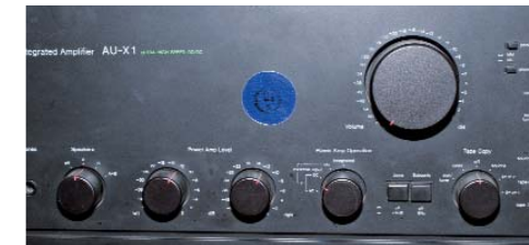
Auch Verstärker mit ihren starken Magnetfeldern sollen von der Harmonisierung per Chip profitieren